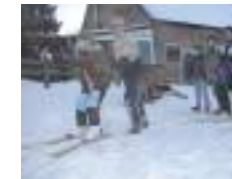
Ski-Hütte Wörschweiler Hof „SC Kirkel“ Hütte in Wörschweiler Hof, Skilift Klosterberglift