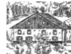
Püttlinger Hütte „TV Püttlingen“ Ventron/Vogesen, 900 m Höhe, Schlafräume, Aufenthaltsräume, Selbstkocherküche - Skilifte im Gebiet von La Bresse