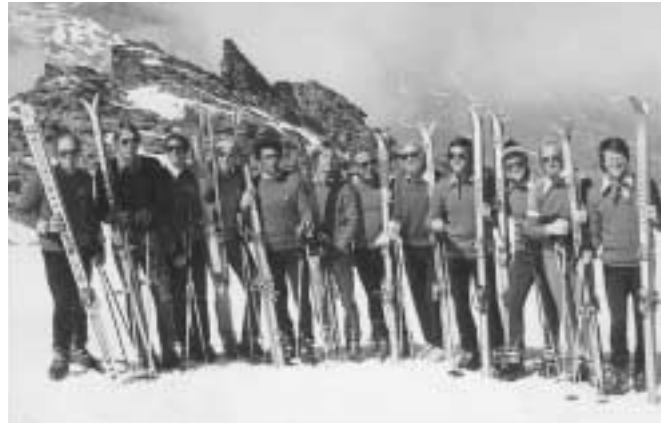
Lehrteam alpin 1975 beim Training in Val Thorens