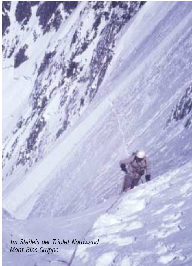
Im Steileis der Triolet Nordwand Mont Blanc Gruppe

Die beiden mitgliederstärksten Vereine im SBSB betreiben neben dem Skilauf alle Formen des Bergsteigens. Hochtouren im Sommer, Skihochtouren im Winter, Felsklettern, Eisklettern, Sportklettern, Wandern, Fami-