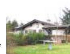
Ski- und Wanderhütte Kirrberg „SV Kirrberg“ Homburg, In den Kalköfen, Hütte ist bewirtschaftet