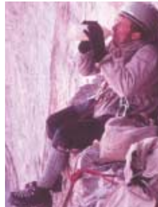
Kleine Rast in der Große-Zinnen Nordwand (Comici-Führe)