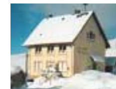
Völklinger Hütte „SC Völklingen“ Herrenschwand/Schwarzwald, 1050 m Höhe, Schlafräume, Aufenthaltsräume, Selbstversorgerhütte, Skilifte in der Nähe