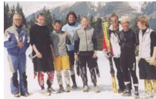
SBSB Rennkader alpin mit Trainern bei der Rheinland-Pfalz-Sportwoche in Hochkrimml, Gerlosplatte 2002.

Auf den Schneemangel in den Mittelgebirgen reagiert man mit der Verlegung der Veranstaltungen in schneesichere Alpenorte. Mit der Masse (der Skibegeisterten) steigt auch die Klasse (der Rennläufer). Junge Skisportlerinnen und Ski-