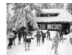
Hütte des Saarländischen Turnerbundes Herzogenhorn/Schwarzwald, 1250 m Höhe, Schlafräume, Aufenthaltsraum, Selbstversorgerhütte, Skilifte und Langlaufloipen in der Nähe