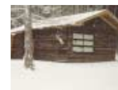
TLH Hütte im Hüttersdorfer Wald „TLH Hüttersdorf“ nicht bewirtschaftet, (keine Betten)