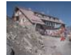
Saarbrücker Hütte „Alpenverein und Skiclub Saarbrücken“ in Parthenen/Montafon (Silvretta), 2538 m Höhe, nur zu bestimmten Zeiten bewirtschaftet