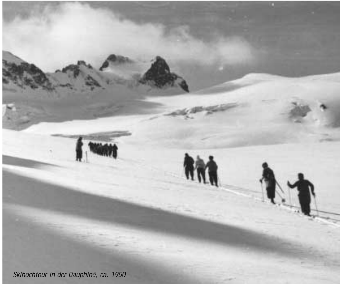
Skihochtour in der Dauphiné, ca. 1950