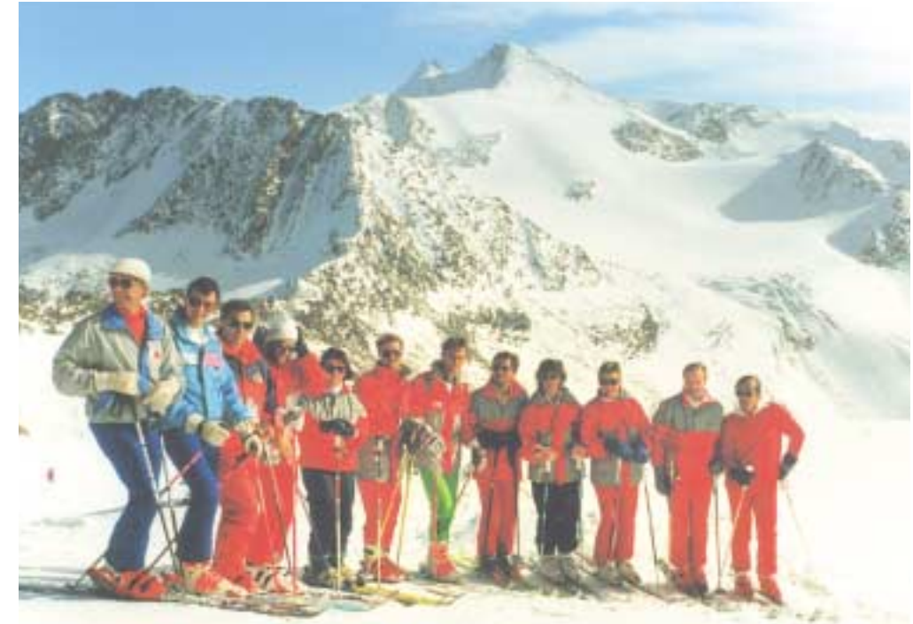
Mitglieder der Saarländischen Skischule um 1980 beim Training auf dem Stubaigletscher