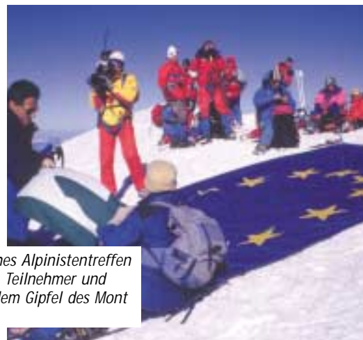
1. Europäisches Alpinistentreffen in Chamonix: Teilnehmer und Medien auf dem Gipfel des Mont Blanc