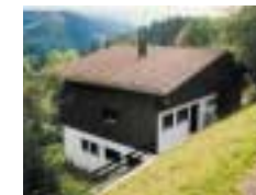
Dudweiler Hütte „AS-Dudweiler“ La Bresse „Belle Hütte“ /Vogesen, 900 m Höhe; 24 B. in 2,3 u. 4-Bettzi., Selbstkocherkü. mit Geschirr, Aufenthaltsr., 16 Skilifte in unmittelbarer Nähe, Langlaufloipen