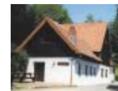
Wiebelskircher Hütte „SC Wiebelskirchen“ „Am kleinen Hohnack“ /Vogesen, 920 m Höhe, Schlafräume, Aufenthaltsräume, Selbstversorgerhütte, Skilifte in der Nähe