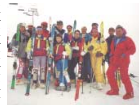
Der Rennkader des SBSB mit Trainern Ende 80er Jahre