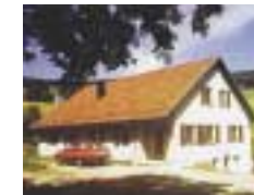
Hohwald Hütte „DAV - Sektion Bergfreunde Saar“ in Le Hohwald (Champ du feu), 960 m Höhe, ca. 22 Betten in 8 Schlafräumen, Selbstkocherküche mit Geschirr, Aufenthaltsräume, Skilift in der Nähe.