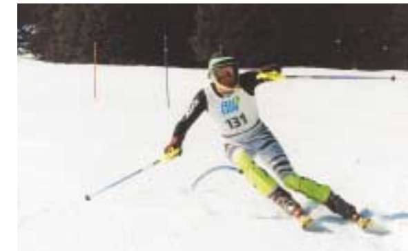
Rheinl.-Pfalz-Sportwoche 2003 in Krimml/Gerlosplatte