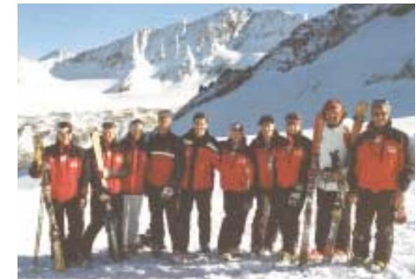
Aktuelles Lehrteam 2002 beim Training im Stubaital