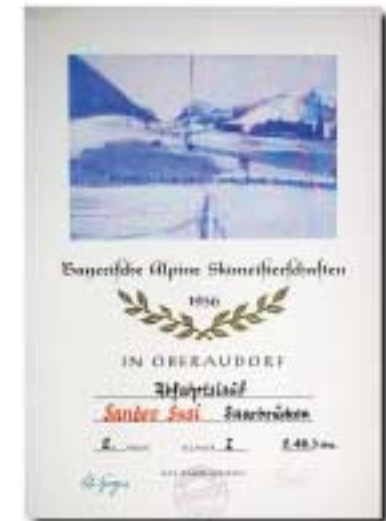
Viele Urkunden und Trophäen geben Zeugnis über eine erfolgreiche sportliche Karriere auf Ski

Danach startet sie noch eine Zeit lang als Mitglied der DSV - Mannschaft erfolgreich bei internationalen Rennen und beendet nach der Saison 1957/58 ihre internationale Laufbahn als alpine Rennläuferin.