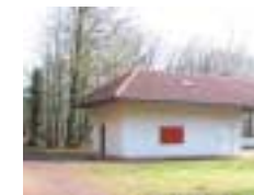
Ski- und Wanderhütte im Stenweiler Wald „SWN Stenweiler“, Hütte ist bewirtschaftet