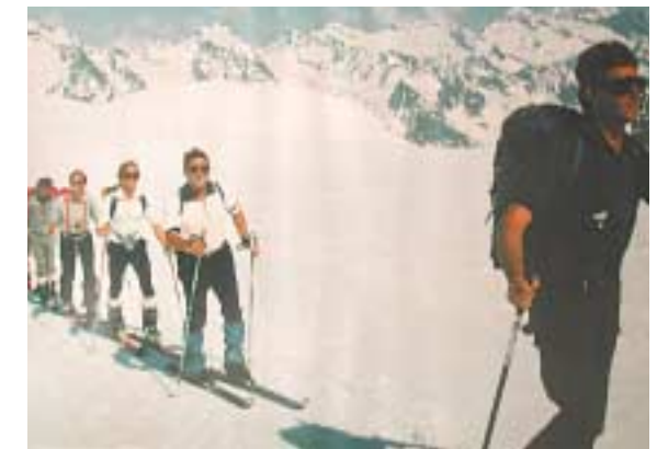
SBSB Landesausbilder auf Skitour: Aufstieg zur Ötztaler Wildspitze