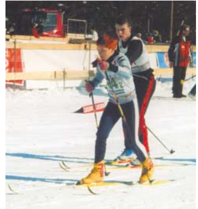
Jugend trainiert für Olympia. Wechsel bei der Langlaufstaffel

Die genannten Disziplinen sind gut geeignet, Talente und Nachwuchs zu fördern und an die Vereine heranzuführen. Sportklettern erweist sich ebenfalls sehr wirkungsvoll bei der Arbeit mit Jugendlichen zur Gewaltprävention. Das Innenministerium des Saarlandes unterstützt diese Aktionen, indem es eigens schulinterne Fortbildungen, an der interessierte Lehrer einer Schule teilnehmen, mit entsprechend ausgebildeten Lehrern anbietet.