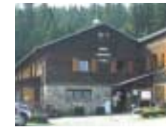
Dr. Franz Merziger Hütte „Alpenverein und Skiclub Saarbrücken“ am Tanet/Vogesen, 1180 m Höhe, bewirtschaftet, ca. 60 Betten, Skilift in der Nähe