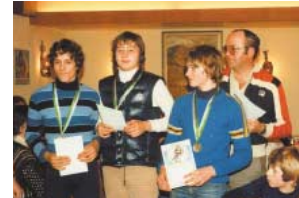
Siegerehrung Saarlandmeisterschaften alpin - Jugend

Für die Zukunft ist wünschenswert, dass sich die Jugendleiter der Vereine zusammen mit dem Jugendreferat des Verbandes stärker um jugendliche Mitglieder bemühen.