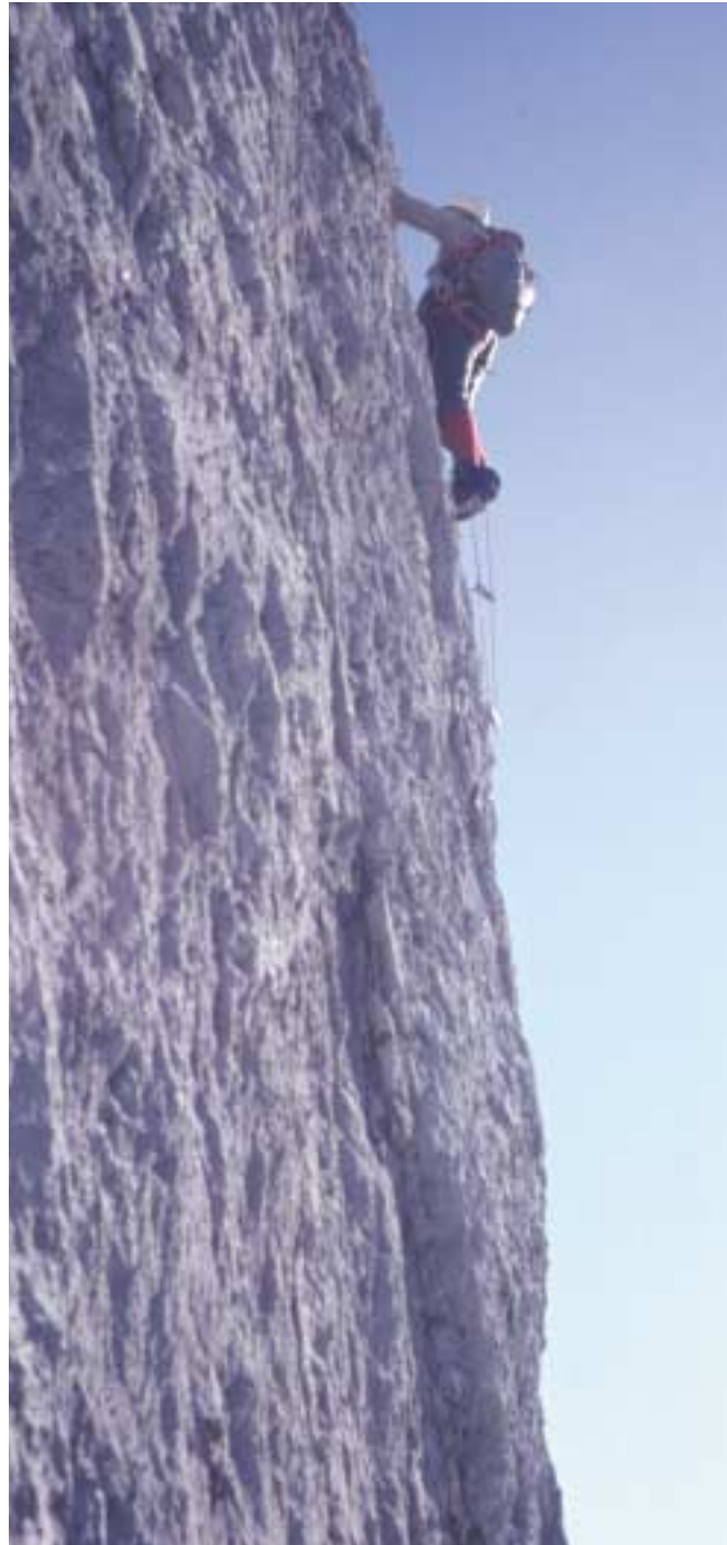
Klettern im extremen Dolomitenfels