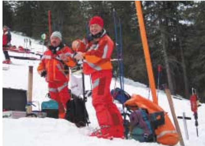
Alpine Kampfrichter im Einsatz bei den saarl. alpinen Meisterschaften in Zöblen/Tannheimer Tal 2002