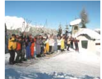
Alpiner Skikurs im Engadin 2003

Ja!!!. Das waren eindeutig die beiden Pitsch-Nass-Parties im Bosarium am Bostalsee im Nov. 1988 (500 Teilnehmer!!) und Nov. 1990, die zusammen mit unseren Surferfreunden vom WindSurf Club Saar veranstaltet wurden.