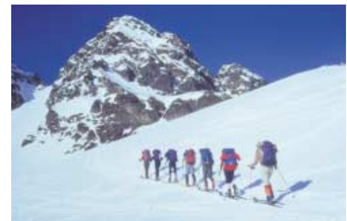
Die Skihochtourengruppe strebt dem Passübergang zu