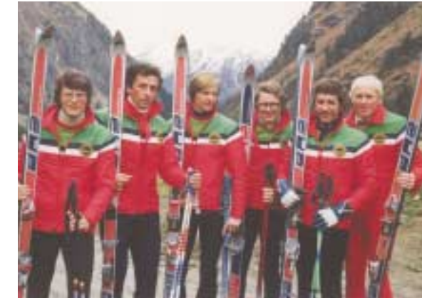
Lehrteam alpin in den 80ern: Skilängen von 25-30 cm über Körpergröße waren zu dieser Zeit selbstverständlich