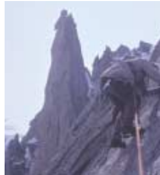
Auf dem Gipfelgrat der Aig. Point-Adolph-Rey (M.B.)

>> Ab Mitte der siebziger Jahre wächst eine neue Klettergeneration heran. Mit neuen Ausbildungskonzepten wird die Lehrarbeit des Verbandes optimiert. Der SBSB bildet verstärkt Kletterübungsleiter aus, um den Bedarf zu decken und die Kletterer für die gestiegenen Anforderungen im allgemeinen Kletterniveau zu rüsten. Mit Wolfgang Kraus wächst ein Bergsteiger und Kletterer heran, der schnell in der internationalen Kletterszene einen Spitzenplatz einnimmt. Als hervorragender Freikletterer wird er Bundestrainer des Kletterkaders des DAV. Neben dem Bergsteigen in den Alpen suchen eine größere Zahl unserer Spitzenleute auch ständig Herausforderungen in den außereuropäischen Gebirgen.