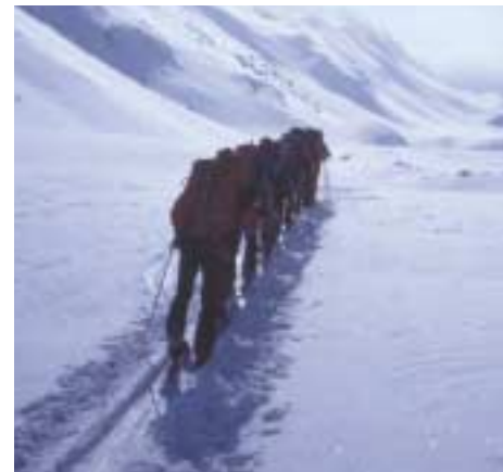
Gruppe im Aufstieg in der Silvretta