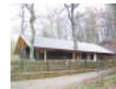
Ski- und Wanderhütte Einöd „Ski- und Wanderfreunde Einöd“, Hütte bewirtschaftet