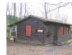
Skihütte Teufelsberg in Wahlschied „Skiclub Heusweiler e.V“ Skilift in unmittelbarer Nähe zum SBSB Trainingszentrum Rollski Alpin (Grasski)